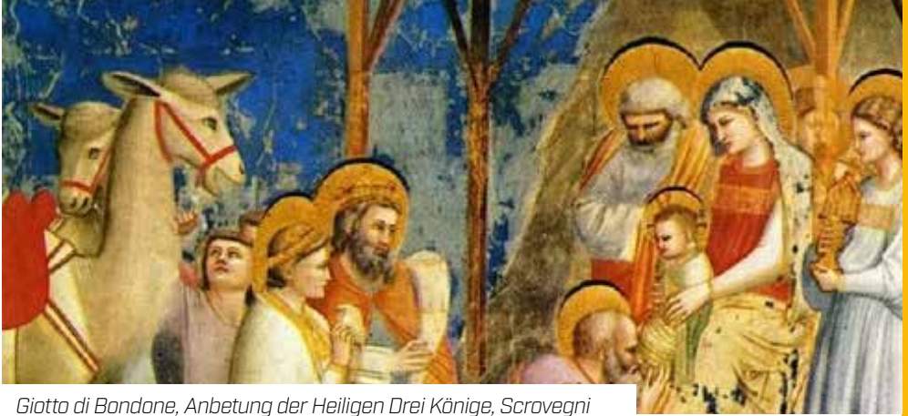
Giotto di Bondone, Anbetung der Heiligen Drei Könige, Scrovegni