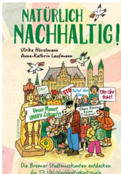
Das Buch „Natürlich nachhaltig“ gibt es überall im Buchhandel.