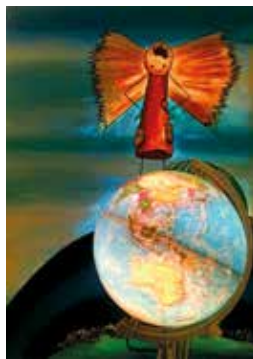
Wo tut's denn weh? fragte der Engel den blauen Stern und der Stern sagte: „Überall.“

heißt es in dem genannten Lied „gestundet ist die Zeit, die uns gegeben.“ Wir sind verantwortlich, für unseren blauen Stern, weil er auch für die nachfolgenden Generationen ein Zuhause ist. Unseren Kindern hinterlasse ich doch kein Zuhause, das nicht mehr sanierbar ist und unbewohnbar. Mein Moleturm hat viele Stürme überstanden. Er ist ein Schmuckstück durch die Zeiten. In seinem Schatten erinnere ich mich, dass die Kirchen seit Jahren Klimaschutz und Nachhaltigkeit auf dem Schirm haben. Leider steht Kirche nicht so populär in der Öffentlichkeit wie Greta Thunberg. Aber das liegt nicht daran, dass Kirchen dazu nichts sagen, sondern daran, dass Kirche für Presse, Funk und Fernsehen aus Sicht der jeweiligen Redaktionen oft nicht themenrelevant ist. Die Kirchen gehörten dennoch zu den ersten, die 1975 das Wort „Nachhaltigkeit“ in der Politik ins Gespräch brachten. Sie forderten schon damals eine „nachhaltige und verantwortliche Gesellschaft“ und haben nie aufgehört, daran zu arbeiten. Das heutige Impulspapier der EKD ist die Agenda 2030, in der sie ihre Klimaziele erneut formulieren. Sie hat den Titel „Geliehen ist der Stern, auf dem wir leben“. Wenn ich den blauen Stern ansehe und ihn frage „Na, kleiner Stern, wo tut's denn weh?“, würde er schluchzen und sagen „Überall“.