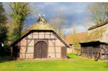
Niedersächsisches Bauernhaus im Museumsdorf Osterholz-Scharmbeck

Wir haben das besondere Vergnügen, uns mit dem Leben und Werk von Jürgen Christian Findorff, dem Moorkolonisator, dessen 300. Geburtstag in diesem Jahr begangen wird, zu beschäftigen. Es gibt eine Sonderausstellung, die sein Leben und Wirken zeigt, und wir