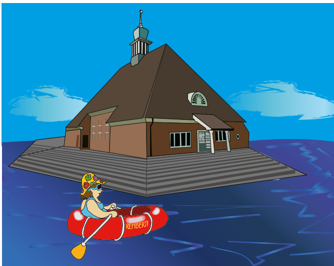
»Ist die Kirche bald per Boot erreichbar?« (Karikatur: I. Klaus, R. Bärje-Keßler)

Endlich bin ich bei der Remberti-Kirche angekommen. Schnell die 17 Stufen hoch und die Kirche aufschließen. Es empfängt mich das sonore Brummen der Klimaanlage, die auf Hochtouren gegen die Wärme ankämpft. Nachdem ich meine Sachen abgelegt habe, gehe ich zu den Schaltern und starte das Glockengeläut. Es tut sich aber nichts. Kein Glockenläuten ist zu hören; stattdessen ein komisches Piepen. Auch das Brummen ist verstummt. Es wird dunkel um mich herum. Bin ich doch zu schnell