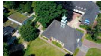
Die Remberti-Kirche von oben

Der Tag des offenen Denkmals wird 2020 erstmals digital stattfinden. Am 13. September wird sich auch die Remberti-Gemeinde erneut