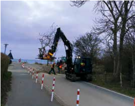
Baumarbeiten in der Strandstraße vor dem Freizeitheim

Nachdem die Umbauphase im Haupthaus zur Saison 2019 weitestgehend abgeschlossen werden konnte, standen zum Ende der abgelaufenen Saison umfangreiche Arbeiten am Gelände an. Im Rahmen des ehrenamtlichen Arbeitsdienstes, der im Anschluss an die Saison durchgeführt wurde, konnten schon etliche Sträucher, Büsche und kleinere Bäume be- und zurückgeschnitten werden. In diesem Zuge wurde auch der Zaun zum Nachbarn Welker ausgebessert und der Zaun