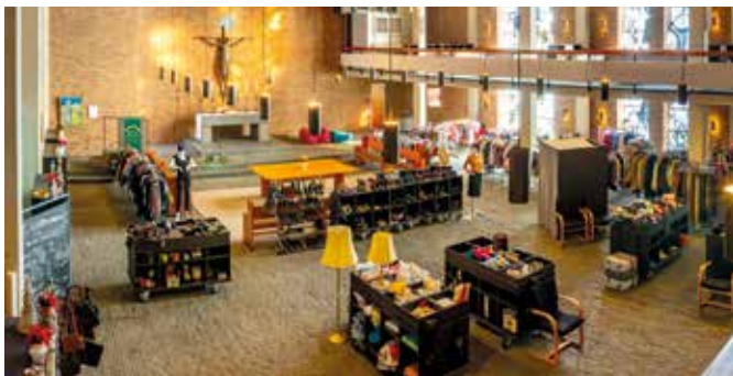
Sozialkaufhaus in der Ev. Kirchengemeinde in der Neuen Vahr

Der Erlös der verkauften Kleider finanziert den kostenlosen Mittagstisch für Kinder „Mahlzeit“, den es seit 12 Jahren gibt, oder die Ausbildung von Kindern in unserem ökumenischen Projekt in Ghana. Neben dem Versorgungsaspekt ist uns vor allem der Nachhaltigkeitsgedanke wichtig.