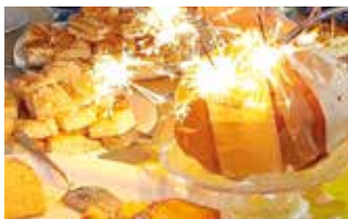
Leckereien auf unserer Kuchentafel